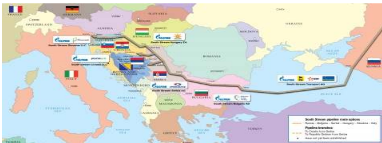
Η προτεινόμενη γραμμή χάραξης του αγωγού South Stream.

Ευρωπαϊκή Επιτροπή ζητά διευκρινίσεις για υπό κατάθεση νομοσχέδιο προτάσει δύο μελών του Κοινοβουλίου, όπου προτείνεται το βουλγαρικό τμήμα του South Stream να θεωρηθεί διασυνδεδετήριος αγωγός και να επιπίπτει στις υποχρεώσεις τρίτων μερών σε αυτόν, βάσει του κοινοτικού Τρίτου Ενεργειακού Πακέτου. Πάντως, η εν λόγω επιστολή της Επιτροπής δε συνιστά έναρξη προδικαστικής διαδικασίας, καθώς αποστέλλεται επί υπό ψήφιση και όχι ψηφισθέντος νομοσχεδίου (Σημ: Το σχετικό νομοσχέδιο εγκρίθηκε τελικά στις 8 Απριλίου).