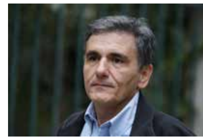
Το Επιμελητήριο Δράμας ζητά από τον υπουργό Οικονομικών Ευκλείδη Τσακαλώτο να αναλάβει άμεσα νομοθετική πρωτοβουλία για την προστασία των μικρομεσαίων επιχειρήσεων

4. Αλλαγές στο διαμορφωθέν πλαίσιο για τις εισαγωγές εμπορευμάτων και πρώτων υλών με αύξηση του ορίου -που ορίστηκε από το capital control- και μείωση των γραφειοκρατικών διαδικασιών. Η βασική αιτία φυγής επιχειρήσεων και κεφαλαίων είναι ο τρόπος λειτουργίας των capital control.