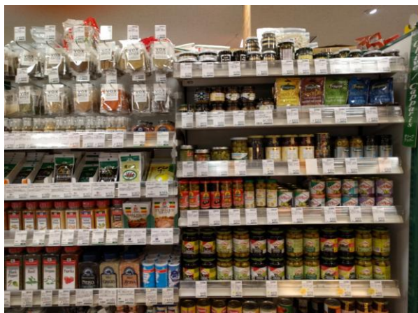
Τοποθέτηση ελιών δίπλα σε σάλτσες και μπαχαρικά