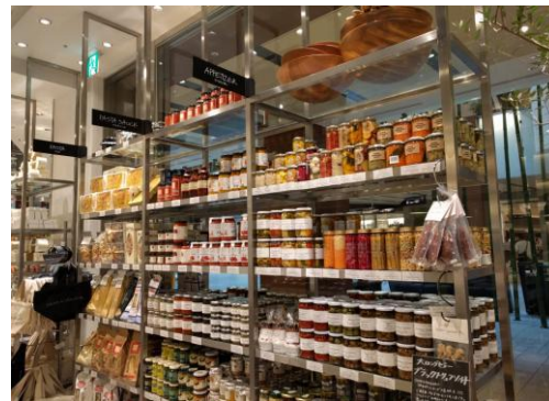
Τοποθέτηση ελιών στο Delicatessen κατάστημα Dean & Deluca, δίπλα σε ορεκτικά, ζυμαρικά και σάλτσες