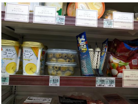
Τοποθέτηση ελιών Nefeli σε πλαστική συσκευασία στο ψυγείο δίπλα σε τυριά και αλλαντικά, kombini shop Family Mart, περιοχή Ropponghi