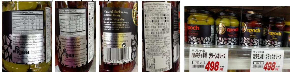
Πράσινες ελιές και ελιές Καλαμών epoch - Elgea

Με σκοπό την διαφοροποίηση, οι ελληνικές ελιές έχουν στην ετικέτα τους αναφορά σε Ολυμπιακούς Αγώνες, στις μοναδικές ποικιλίες π.χ. Καλαμάτα, στον παραδοσιακό τρόπο συγκομιδής.