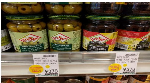
Ελιές σε γυάλινη συσκευασία εκτός ψυγείου

Η πλέον δημοφιλής συσκευασία είναι η γυάλινη, σε διάφορα μεγέθη. Στην αγορά κυκλοφορούν ελιές με προσεγμένη ετικέτα σε μικρή γυάλινη συσκευασία που ανταποκρίνονται στις ιαπωνικές προσδοκίες ενός προϊόντος υψηλής γαστρονομίας κυκλοφορούν όμως και πλαστικές ή μεταλλικές συσκευασίες με εύκολο άνοιγμα καθώς και ατομικές συσκευασίες. Δεν γίνονται αποδεκτές όμως από τον καταναλωτή φθορές στην συσκευασία, στο καπάκι ή στην ετικέτα.