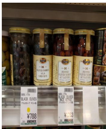
Ισπανικές ελιές Fragata, Snack'n Olive, Olives with a touch of Greece

Περιπτώσεις κατά τις οποίες μη ελληνικές εταιρίες παρέπεμπαν στην Ελλάδα: