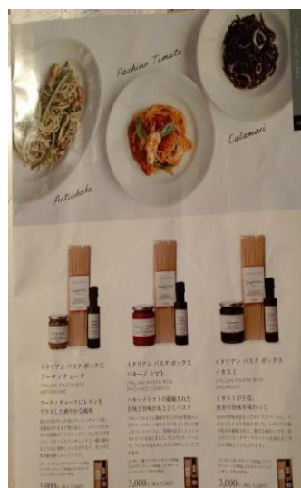
Πρόταση μαγειρικής με ελιές, ελαιόλαδο, χοντρό αλάτι, αποξηραμένες ντομάτες, ψητές αγκινάρες ή σε συνδυασμό με σάλτσα και спаγγέτι. στον κατάλογο του Delicatessen Dean & Deluca.