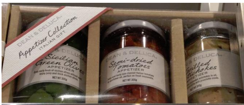
Πράσινες ελιές Σικελίας, αποξηραμένες ντομάτες, αγκινάρες, στην ίδια συσκευασία, κατάστημα Delicatessen Dean & Deluca.