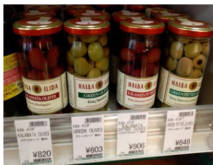
Ελιές Καλαμών και ελιές πράσινες (ολόκληρες και εκπηρηνωμένες) Ilida