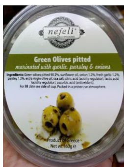
Πράσινες ελιές Nefeli μαριναρισμένες με μαϊντανό, σκόρδο και κρεμμύδια