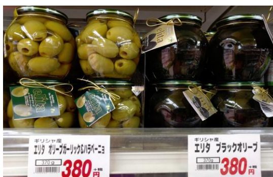
Πράσινες και μαύρες ελιές Elita