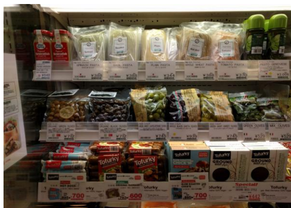
Τοποθέτηση ελιών σε πλαστική συσκευασία στο ψυγείο δίπλα σε φρέσκα ζυμαρικά και σάλτσες