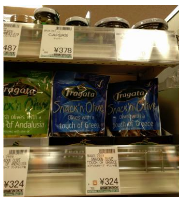
Γαλλικές ελιές Barral Olives Noires à la Grecque .