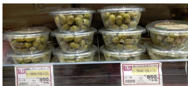
Ελιές σε διαφορετικές πλαστικές συσκευασίες στο ψυγείο