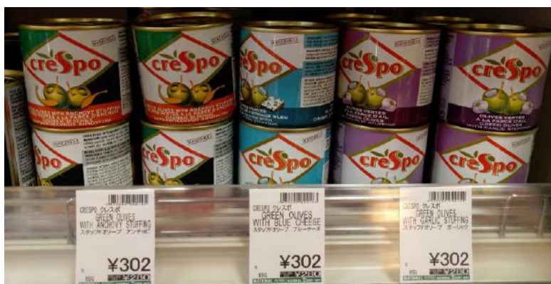
Μεταλλική συσκευασία ελιών με εύκολο άνοιγμα