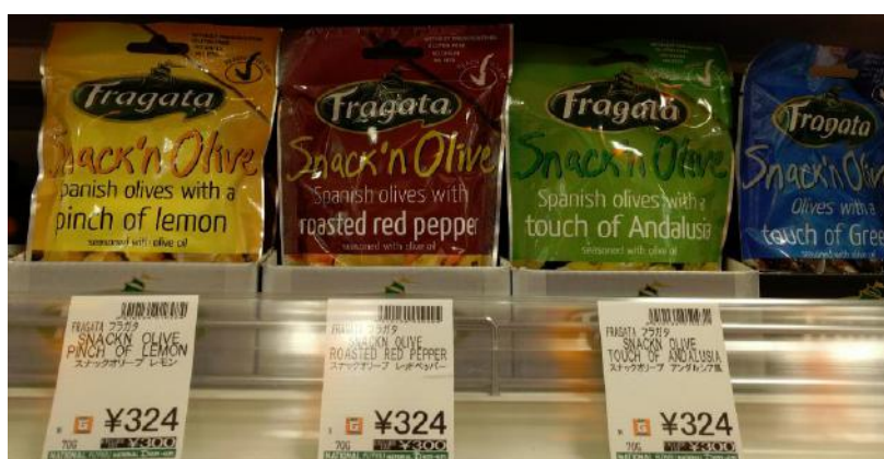
Ατομικές συσκευασίες σε μορφή σνακ