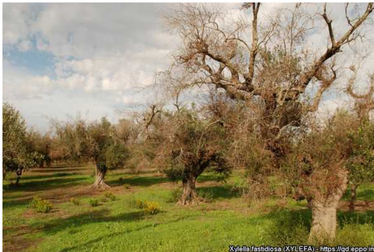
Προσβεβλημένα δένδρα ελιάς στην Ιταλία από Xylella fastidiosa.

Οι Δήμοι της Π.Ε. Δράμας, στους οποίους κοινοποιείται το παρόν έγγραφο, παρακαλούνται να το αναρτήσουν σε πίνακες ανακοινώσεων. Το ΓΕΩΤ.Ε.Ε. - Παράρτημα Ανατολικής Μακεδονίας παρακαλείται να ενημερώσει σχετικώς τα μέλη του.