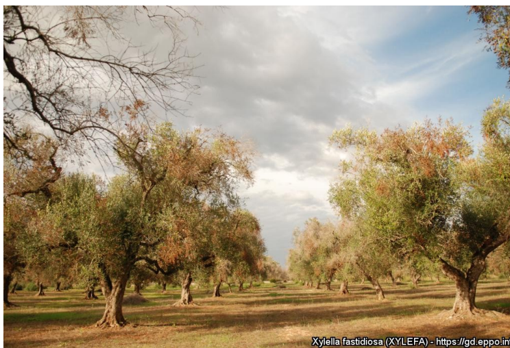
Προσβεβλημένα δένδρα ελιάς στην Ιταλία από Xylella fastidiosa.

Οι Δήμοι της Π.Ε. Δράμας, στους οποίους κοινοποιείται το παρόν έγγραφο, παρακαλούνται να το αναρτήσουν σε πίνακες ανακοινώσεων. Το ΓΕΩΤ.Ε.Ε. - Παράρτημα Ανατολικής Μακεδονίας παρακαλείται να ενημερώσει σχετικά τα μέλη του.